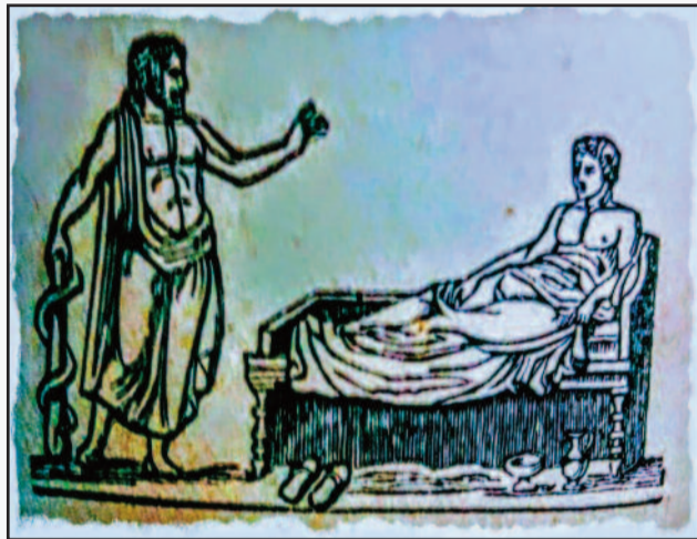
Φωτὸ 1. Σκηνὴ Εγκοίμησης Ασκληπιείου με τον νοσοῦντα, κλινῆρη μετὰ τον καθαρμὸ και τὴν ἐπιφάνεια τού Θεοῦ με τὴν ἰατρικὴ ράβδο και τον ἱερό ὄφι. (βλ. Π.Γ. Δημάκης η ἐν ΕΛΑΤΕΙΑ Εγκοίμησις 9η Πανελλήνια Διημερίδα Ἱστορίας τῆς Ἰατρικῆς 2011 ΕΚΠΑ Εργαστήριον Ἰατρικῆς).

Γράφει ο Παν. Γεωρ. Δημάκης, Υπεύθυνος Ιστορικού Αρχείου Δήμου Αμφικλείας Ελατείας • Email: pgdimakis@gmail.com