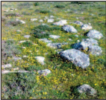
(Φωτὸ 3) Στο κέντρο τῶν ερειπίων τῆς Ελάτειας, διεσώθησαν τα ἰχνη τού Ναοῦ τού Ἁγ. Δημητρίου. Εικάζεται ὅτι ἦταν ἐκεῖ, η Αγορὰ και πολλά ψηφίσματα και ἐπιγραφές, πολλά ἀπό τα οποία ἀνέστυρε ο P. Paris. (π.χ. Λίθος Κανά) και ἀνέδειξε μερικῶς.

σύνδεση τού Ασκληπιείου Ελάτειας, με τὴν ἰατρικὴ πρακτικὴ και ἰσως, τον χώρο τῶν ἰατρικῶν πράξεων, βλ. φωτὸ 2. (Supplementum Epigraphicum Graecum, III, 416, second century B.C.).