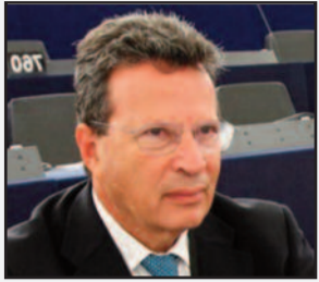
Γιώργος Κύρτσος Ευρωβουλευτής της ΝΔ

Λιγότερα δικαιώματα λόγω πλάστων ταυτοτήτων! Η διαμάχη που έχει ξεσπάσει μεταξύ γερμανικών και ελληνικών αρχών γύρω από τη μεταχείριση των Ελλήνων που επισκέπτονται τη Γερμανία αναδεικνύει, για μία ακόμη φορά, τον διαλυτικό ρόλο της κυβέρνησης Τσίπρα.