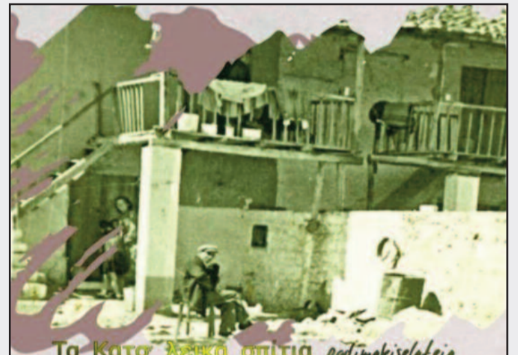
Τα παλαιά οικήματα του Δραχμανίου πού διασώζονται ακόμη