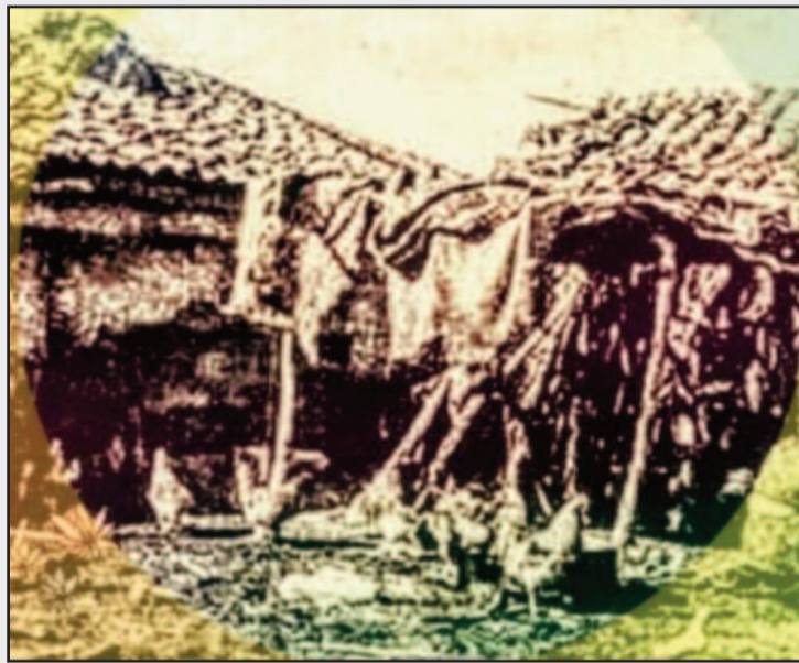
Υπαίθρια κτηνοτροφική εγκατάσταση. Ευτυχισμένα πουλερικά, τσιμπολογούν έντομα, πού συγκεντρώνονται όπου στάζει ο ορός, τού γάλακτος από τις τσαντίλες.

Γράφει ο Παν. Γεωρ. Δημάκης, Υπεύθυνος Ιστορικού Αρχείου Δήμου Αμφικλείας Ελατείας • Email: pgdimakis@gmail.com