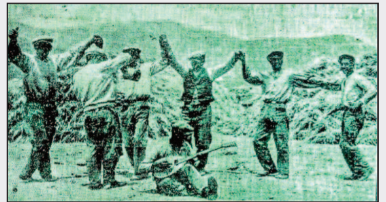
Τ' αλωνισμα τελείωσε η παραγωγή επαρκής για τούς λιτοδίαιτους, ο ιερός κύκλιος χορός, στο βουνίσιο πλάτωμα, καλά κρατεί κι τ' χρον....

-Ο πολλαπλασιασμός, η εξευγένισις και η διάδοσις, τών δένδρων και ιδίως, των οπωροφόρων.