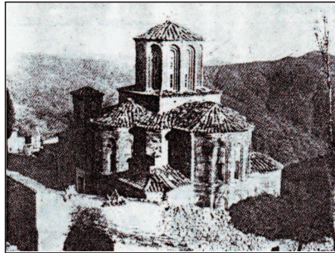
Το ιστορικό Καθολικό της Μονής (φωτ. 1930)

να φέρει έναν άξιο διάδοχο και ικανό συνεχιστή του έργου του, που θα αξιοποιήσει την αποκατεστημένη υλικοτεχνική υποδομή της Μονής και θα αποδώσει κοινωνικό έργο. Αυτό έγινε από τις 2 Μαΐου 2016, που ανέλαβε ο αρχιμανδρίτης π.