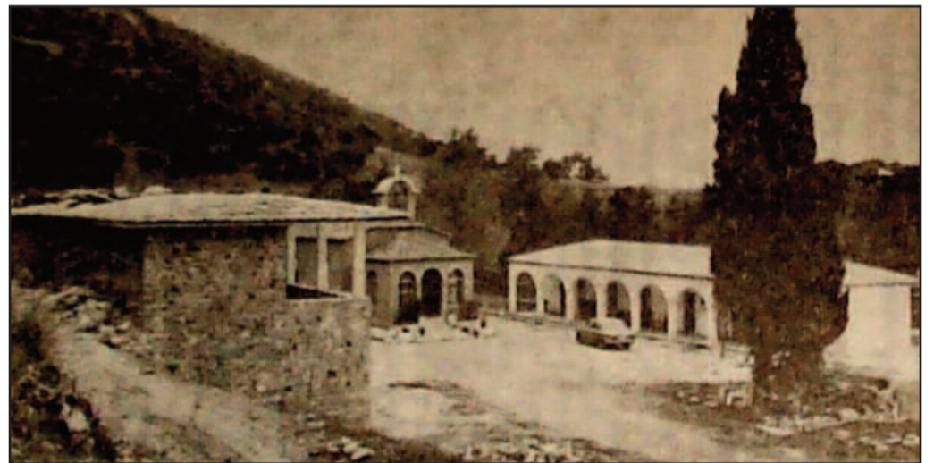
Μόνο το κυπαρίσσι έμεινε από την καταστροφή του 1944. Το εκκλησάκι και τα ημιτελή κτίρια έγιναν τη δεκαετία του '70.