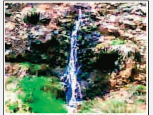
φωτο 2. Η πηγή ΣΚΑΣΜΕΝΗ τώρα