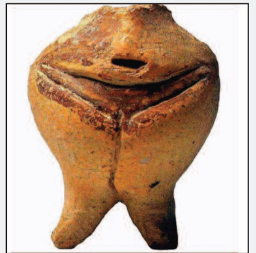
φωτο 3. Νεολιθικό ειδώλιο με διακριτή εγχάρακτη δήλωση φύλου