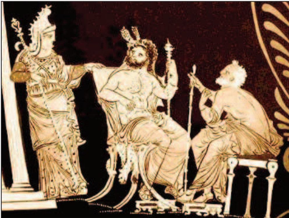
Ραδάμανθς, Μίνως, και Αιακός, οι τρεις αρχαίοι βασιλείς - δικαστές του Κάτω Κόσμου

Ο ήσος του γενάρχη των Αιακιδών ήταν οι Μυρμιδόνες, οι τρομεροί πολεμιστές και πιστοί ακόλουθοι του Αχιλλέα που στην Τροία σπέρναν τον θάνατο στους Τρώες.