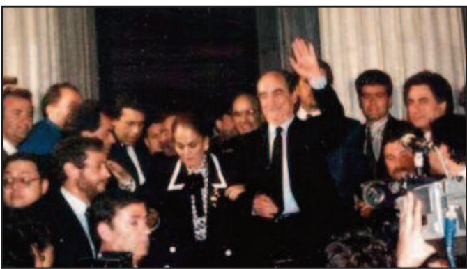
Πρωθυπουργός Κώστας Μητσοτάκης

Ορθή πολιτική ρητορική για αποκατάσταση της δημοσιονομικής πειθαρχίας και για προώθηση των αποκρατικοποιήσεων. Δεν τελεσφόρησε, κυρίως, γιατί το πολιτικό και κοινωνικό περιβάλλον ήταν εχθρικό. Το 1992 υπεγράφη η συνθήκη του Μάαστριχτ, οπότε η οικονομία εκτέθηκε σε τρίτο κύμα διεθνοποίησης μετά το πρώτο του 1961 και δεύτερο του 1981.