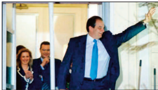
Πρωθυπουργός Κώστας Καραμανλής

Η περίοδος θα εξετασθεί σε δύο υποπεριόδους, πριν και μετά το ξέσπασμα της παγκόσμιας κρίσης.