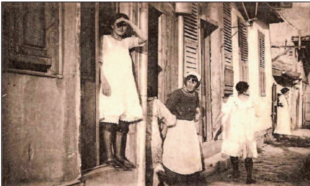
Γυναίκες περιμένουν τον πελάτη (Συνοικία Βαρδαρίου Θεσσαλονίκης)

Το 1930, με τον συμπληρωματικό νόμο 19/1930 καθοριζόταν ο τρόπος νοσηλείας των εκδιδόμενων γυναικών, η πληρωμή των νοσηλίων, η μετακίνηση σε άλλη πόλη, κ.ά. Οι γυναίκες εξετάζονταν δύο φορές την εβδομάδα από αφροδισιολόγο. Όταν είχαν τα έμμηνα (περίοδο), δεν δέχονταν πελάτες. Χωρίς άδεια, δεν μπορούσαν να βγουν από τον οίκο ανοχής! Με άλλα λόγια ήταν φυλακισμένες. Οι τιμές ήταν από 25 δρχ.