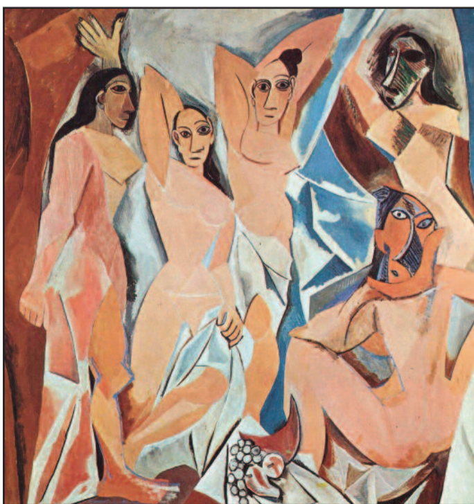
Οι δεσποινίδες της Αθηνών (1907, Πικάσσο) Αναφέρεται σε πορνείο στην οδό Αγιών της Βαρκελώνης.

Από την περίοδο 1929-34, σε παλιό κτίριο (ιδιοκτησίας Βογιατζή), που βρισκόταν στη ΝΑ γωνία των οδών Κολλοκοτρώνης