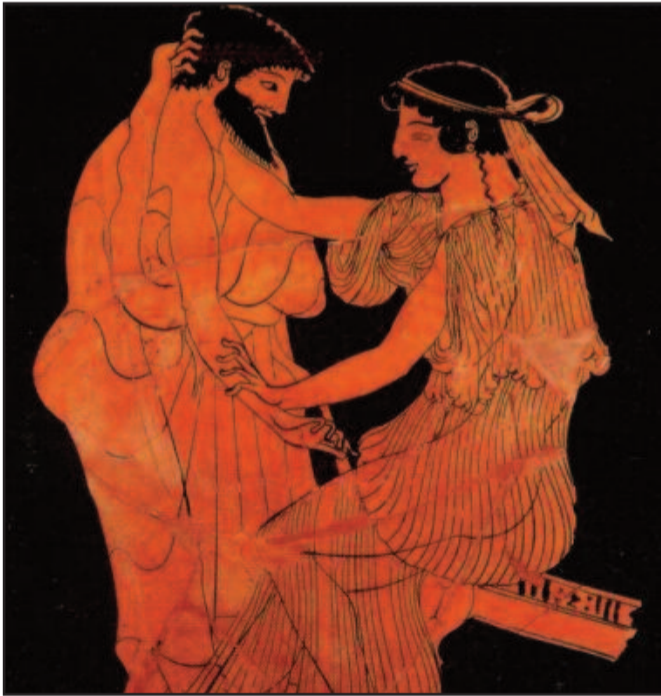
Συλεύρεση άνδρα με εταίρα (490-480 π.Χ.)

Ειδικά για την Κόρινθο, όπως αναφέρει ο Στράβων (από το 44 π.Χ.), ότι είχε χίλιες και πλέον ιερόδουλες-εταίρες στο ιερό της Αφροδίτης (Ιερά Πορνεία). Αυτές έφερναν σημαντικό πλούτο στην πόλη (κυρίως από τους διερχόμενους ναυτικούς 3 ).