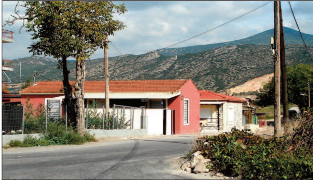
Ανακαινισμένα κτίρια των "σπιτιών" της Λαμίας (17-10-2015)

Στις μέρες μας, τα κορίτσια των οίκων ανοχής, μπορούν να κυκλοφορούν ελεύθερα και τα σπίτια με τα «κόκκινα φανάρια» δεν θυμίζουν εκείνα του παρελθόντος. Οι σύγχρονοι οίκοι ανοχής διαθέτουν μέχρι και σελίδες στο διαδίκτυο, όπου οι πελάτες περιγράφουν τις εμπειρίες τους και αξιολογούν τα κορίτσια και το "σπίτι".